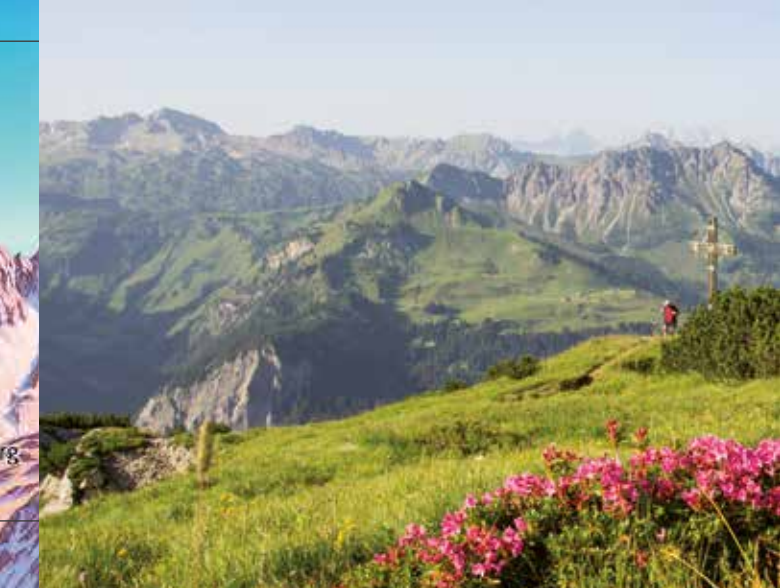
Panoramablick von der Blasenka Richtung Kellaspitze und Alpe Steris

Detaillierte Infos zu den Öffnungszeiten der Gastronomiebetriebe, die genauen Wegbeschreibungen für die Themenwege oder auch eine interaktive Wander- und Radkarte sowie weitere Informationen finden Sie online unter: www.walsertal.at