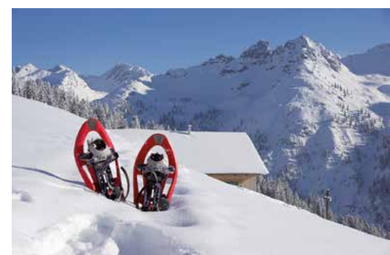
Weitblicke im Großen Walsertal