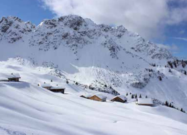
Alpe Oberpartnom in Sonntag-Stein

Die speziell errichteten „Entschleunigungsplätze“ im Großen Walsertal sollen zum bewussten Stehenbleiben, Genießen und zur Ruhe kommen einladen. Alle Plätze sind mit diesem Symbol im Übersichtsplan und auch direkt vor Ort gekennzeichnet und laden Sie ein, vorbei zu kommen. Die genauen Standorte finden Sie unter www.walsertal.at/entschleunigung