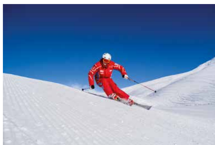
Skivergnügen im Großen Walsertal